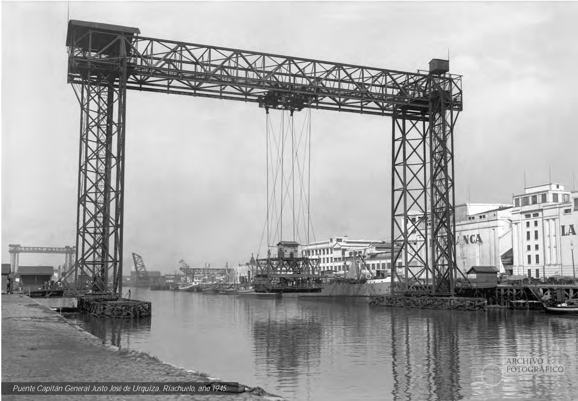
Puente Capitán General Justo José de Urquiza. Riachuelo, año 1945.