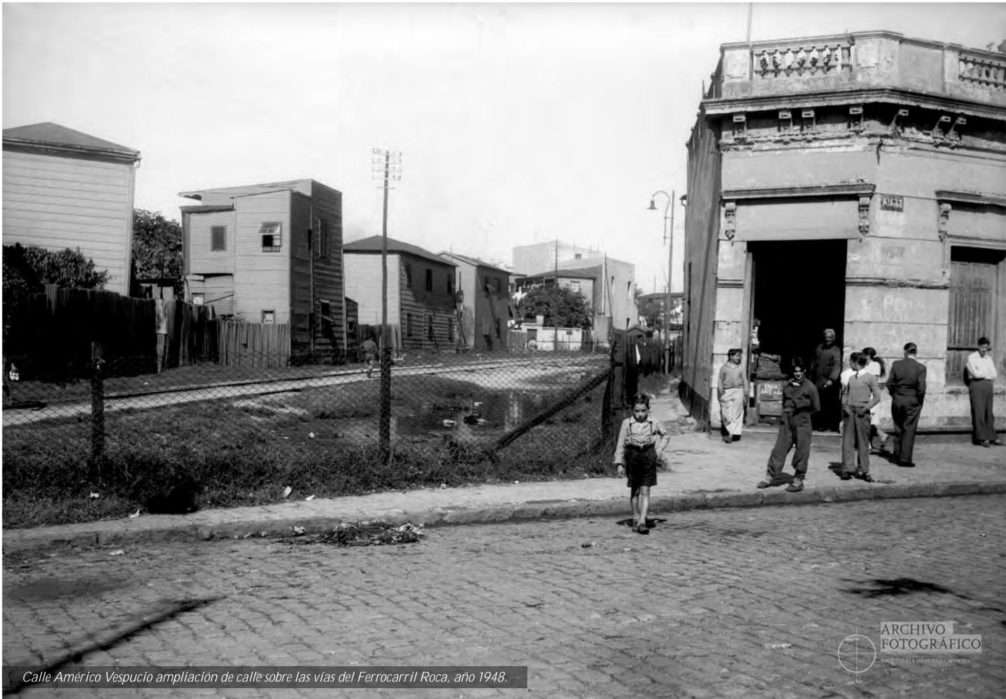
Calle América Vespucio ampliación de calle sobre las vías del Ferrocarril Roca, año 1948.