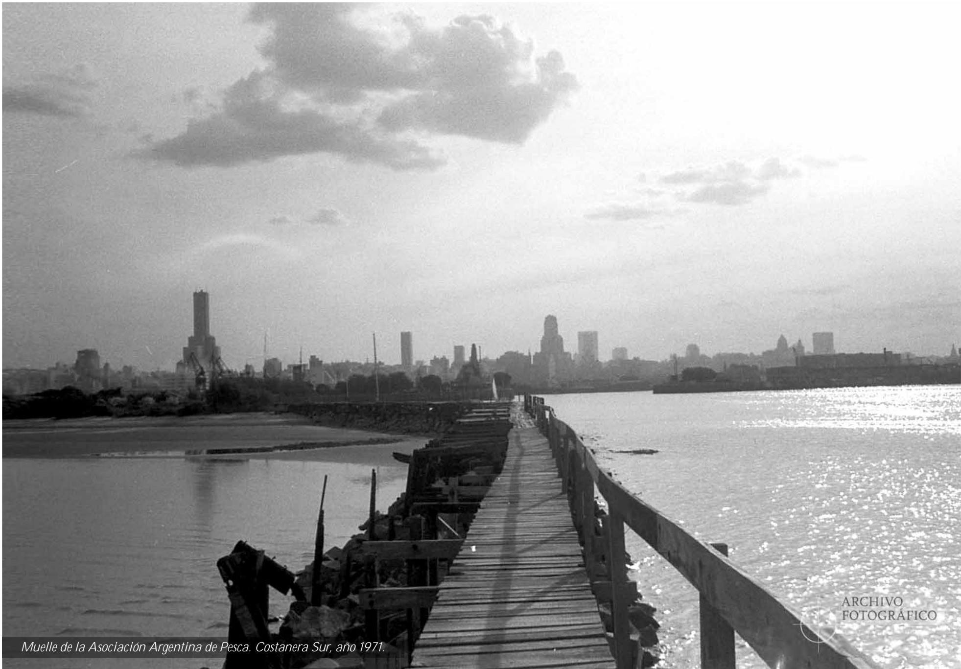
Muelle de la Asociación Argentina de Pesca. Costanera Sur, año 1971.