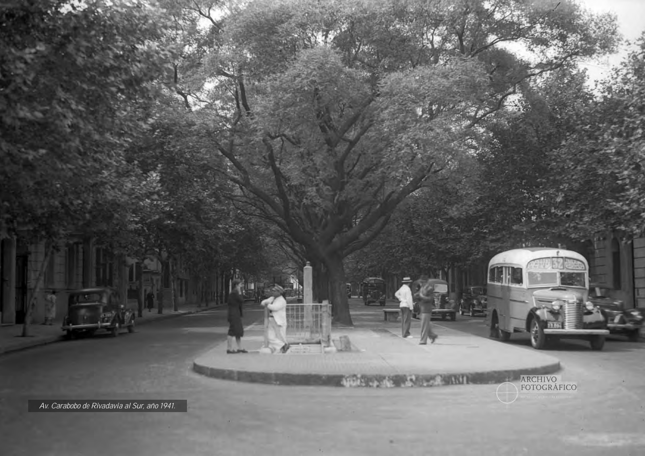
Av. Carabobo de Rivadavia al Sur, año 1941.