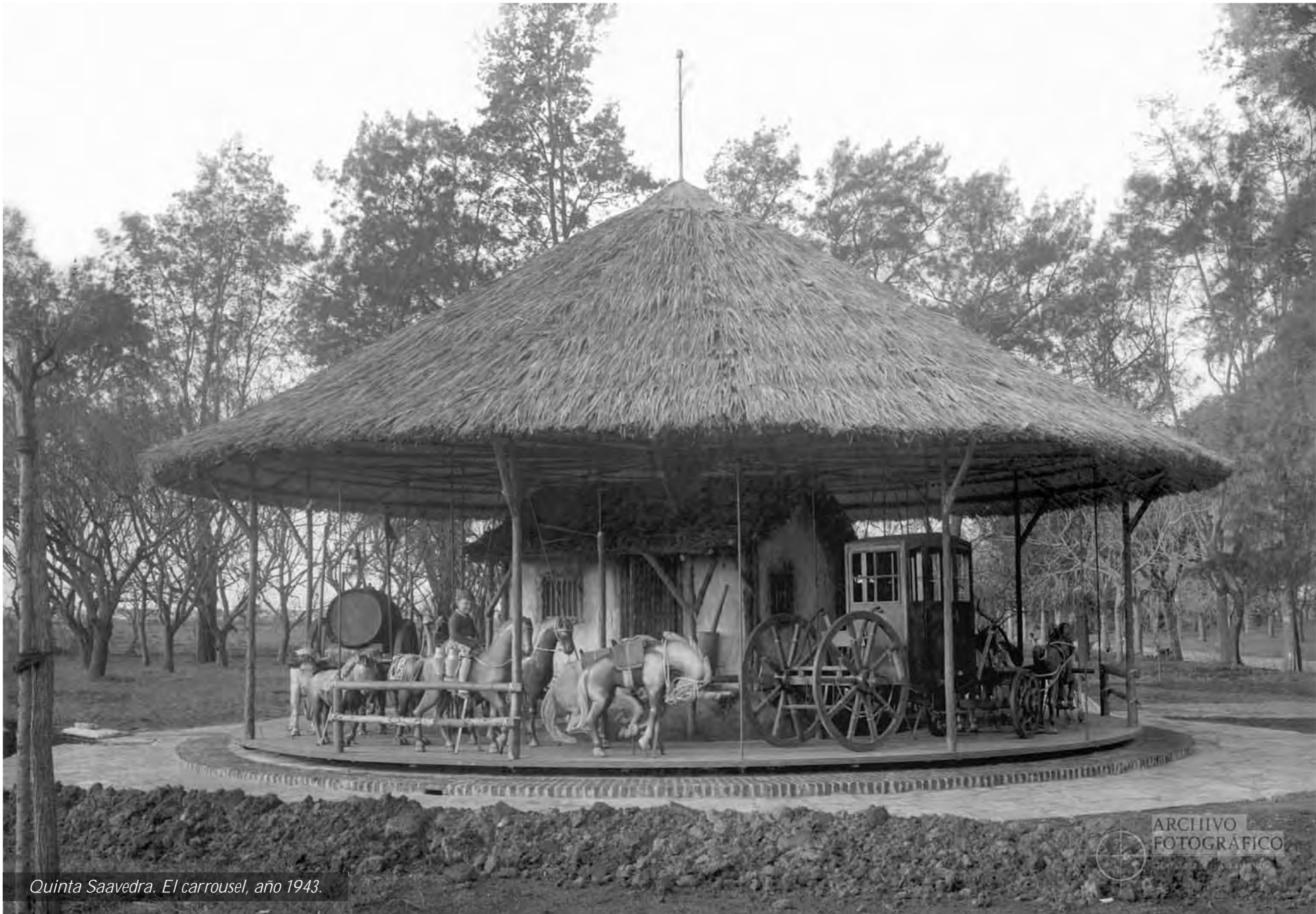
Quinta Saavedra. El carrusel, año 1943.