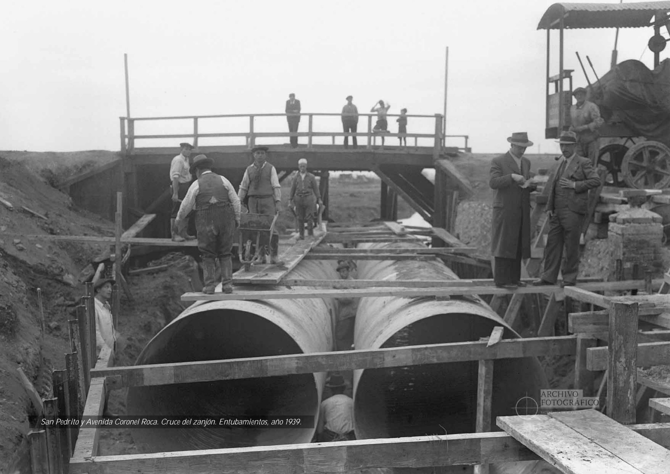
San Pedrito y Avenida Coronel Roca. Cruce del zanjón. Entubamientos, año 1939.