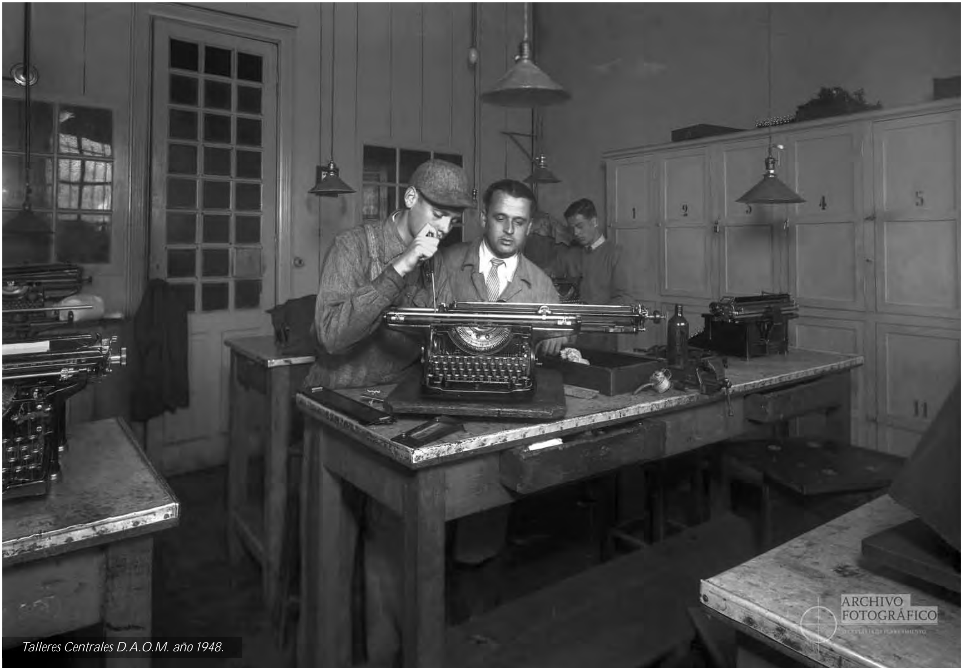
Talleres Centrales D.A.O.M. año 1948.