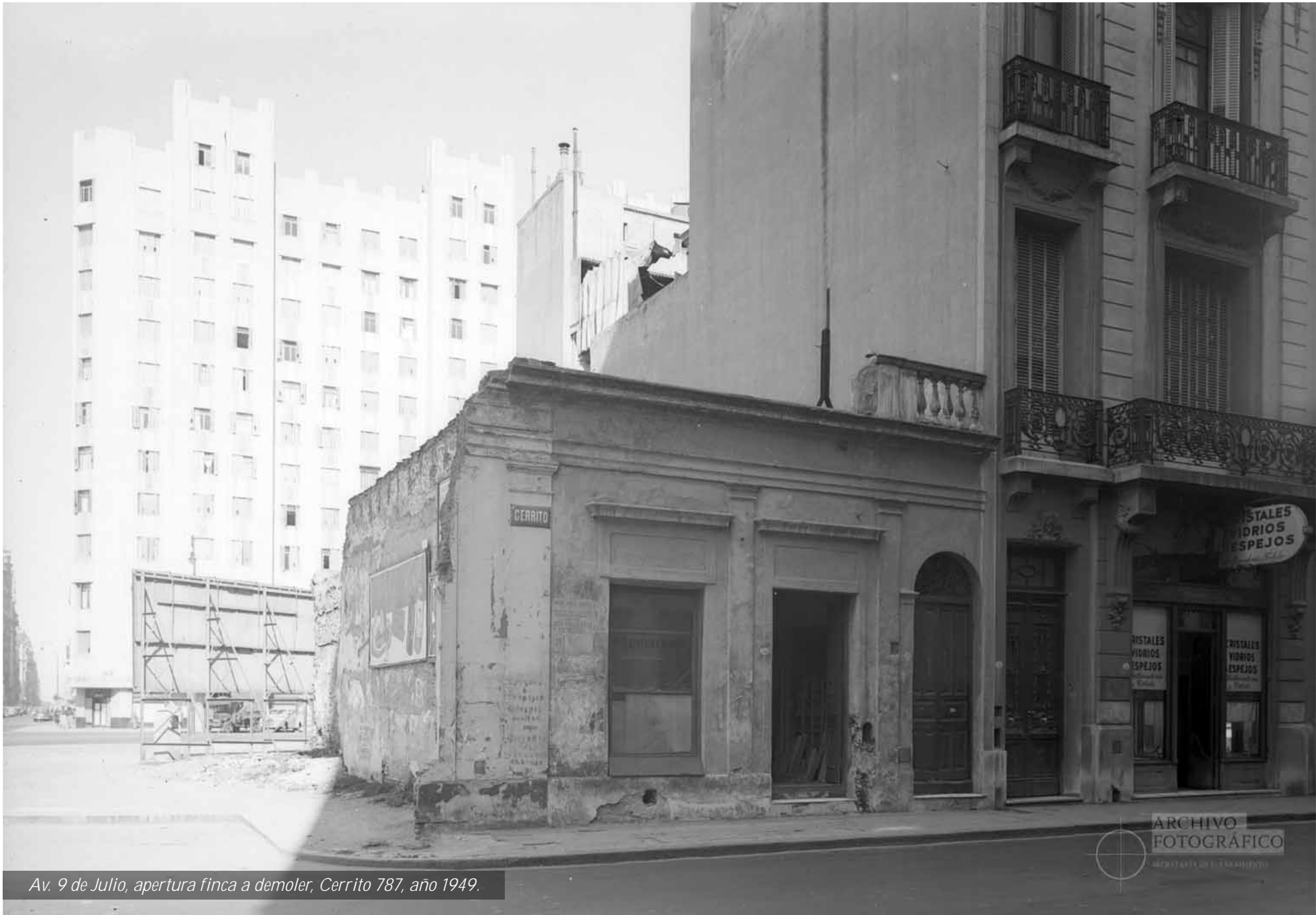
Av. 9 de Julio, apertura finca a demoler, Cerrito 787, año 1949.