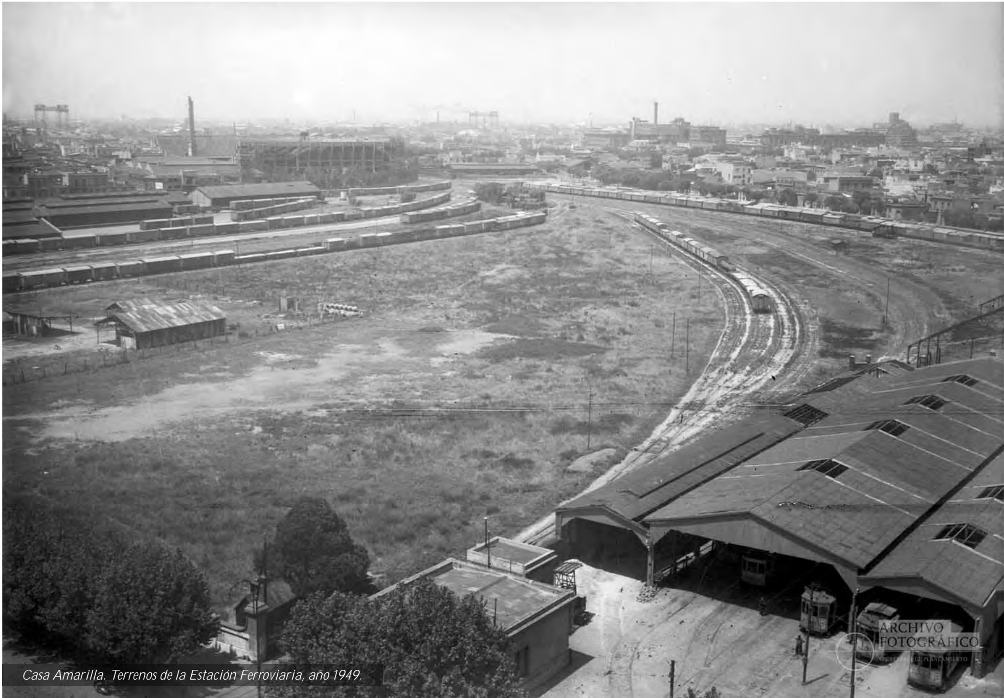
Casa Amarilla. Terrenos de la Estación Ferroviaria, año 1949.