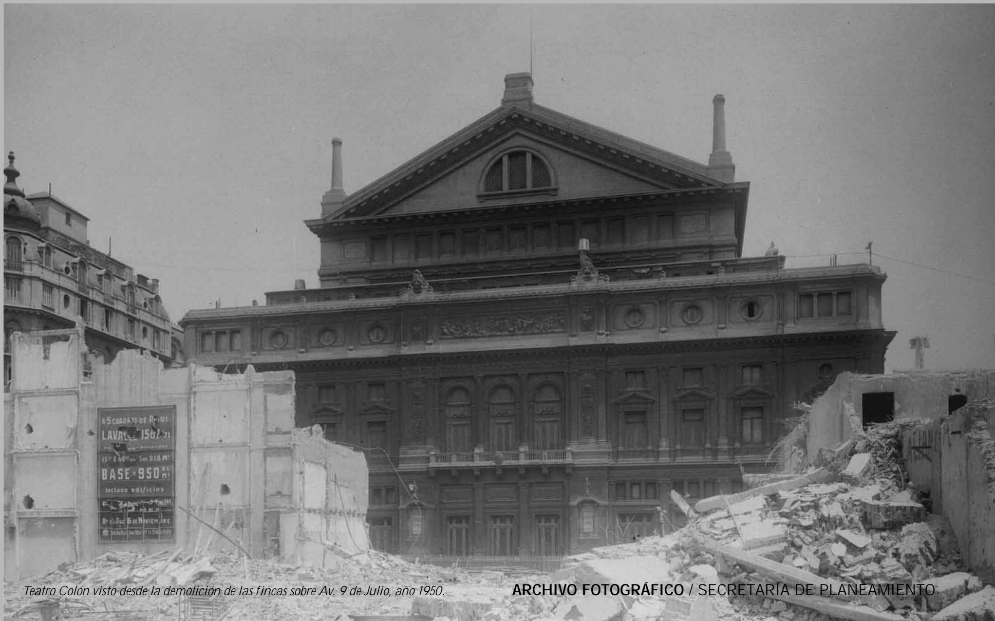
Teatro Colón visto desde la demolición de las fincas sobre Av. 9 de Julio, año 1950.