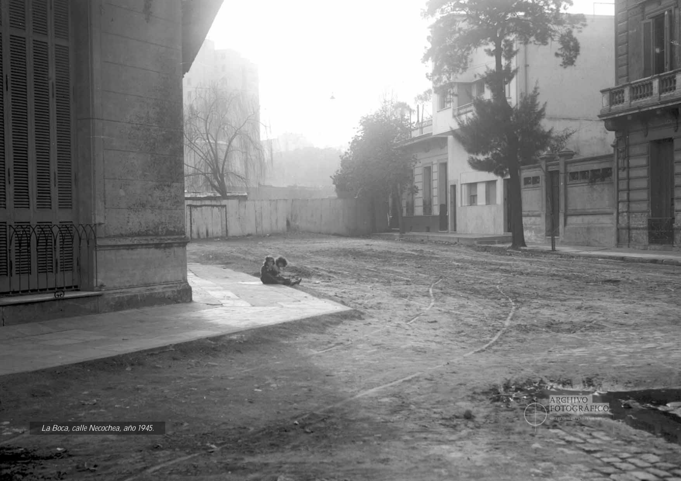
La Boca, calle Necochea, año 1945.