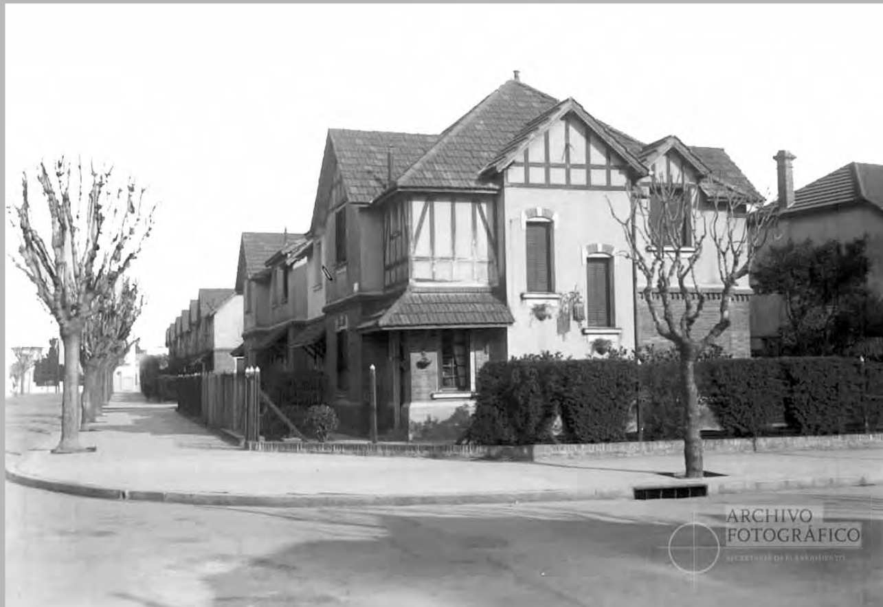
Casas colectivas e individuales del Barrio Rawson, año 1946.