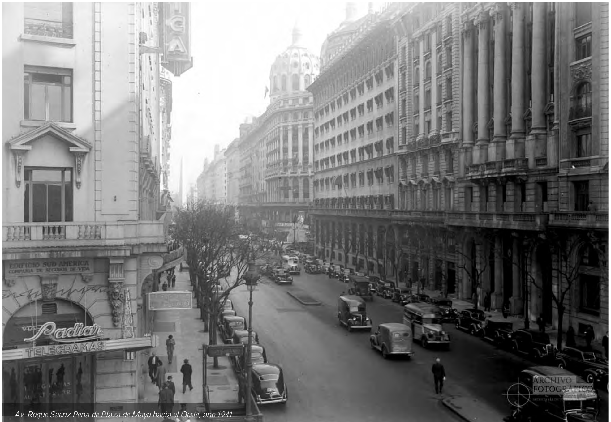
Av. Roque Saenz Peña de Plaza de Mayo hacia el Oeste, año 1941.