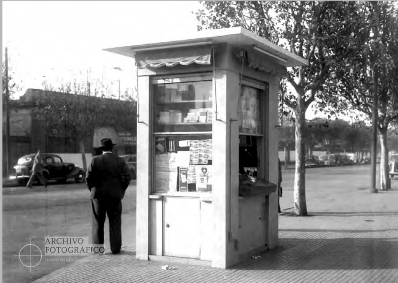
Kiosco en Federico Lacroze esquina Alvarez Thomas, año 1947.