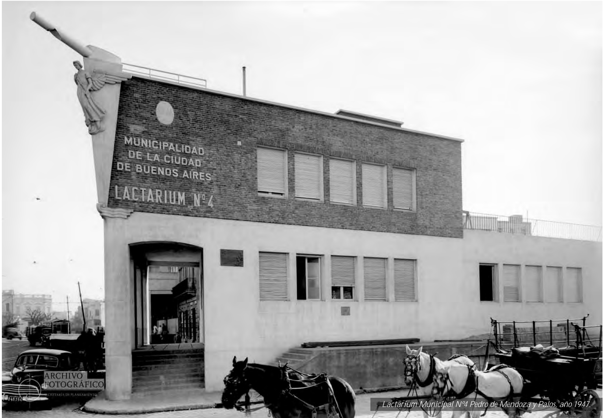
Lactarium Municipal N°4 Pedro de Mendoza y Palos, año 1947.