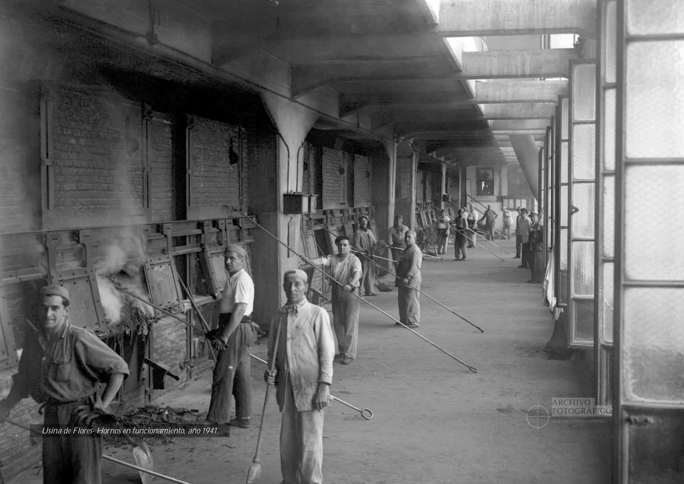
Usina de Flores- Hornos en funcionamiento, año 1941.