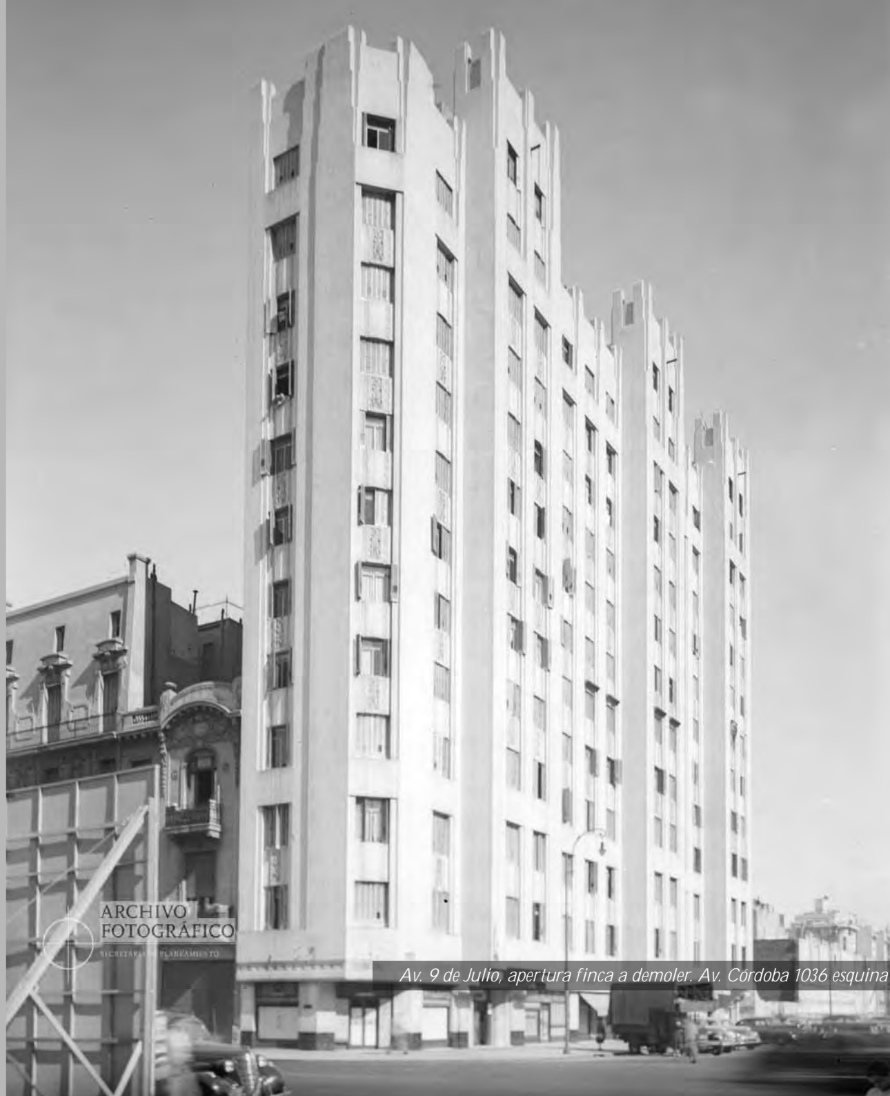
Av. 9 de Julio, apertura finca a demoler. Av. Córdoba 1036 esquina Av. 9 de Julio 851, año 1949.