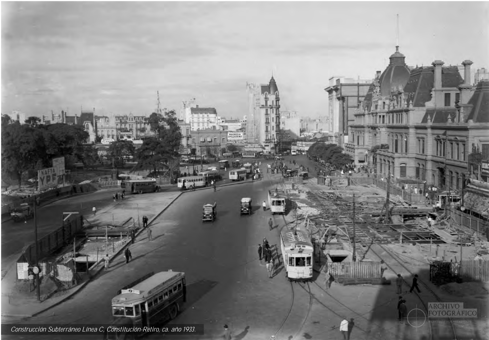
Construcción Subterráneo Línea C, Constitución-Retiro, ca. año 1933.