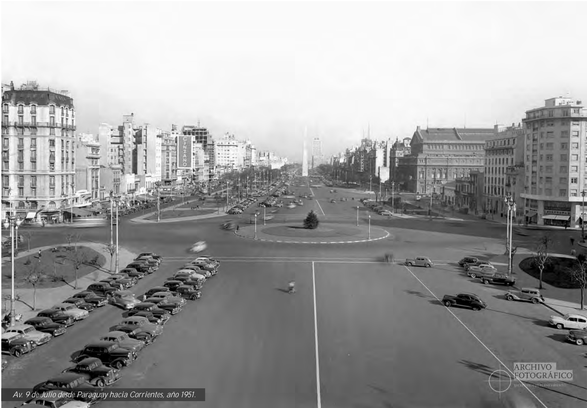
Av. 9 de Julio desde Paraguay hacia Corrientes, año 1951.