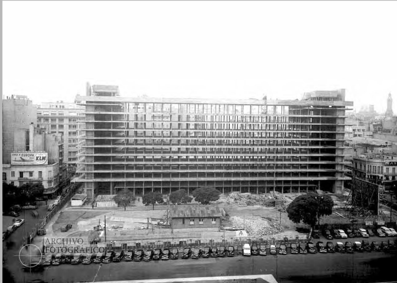
Construcción del Edificio del Plata, vista general sobre la Av. 9 de julio año 1954.