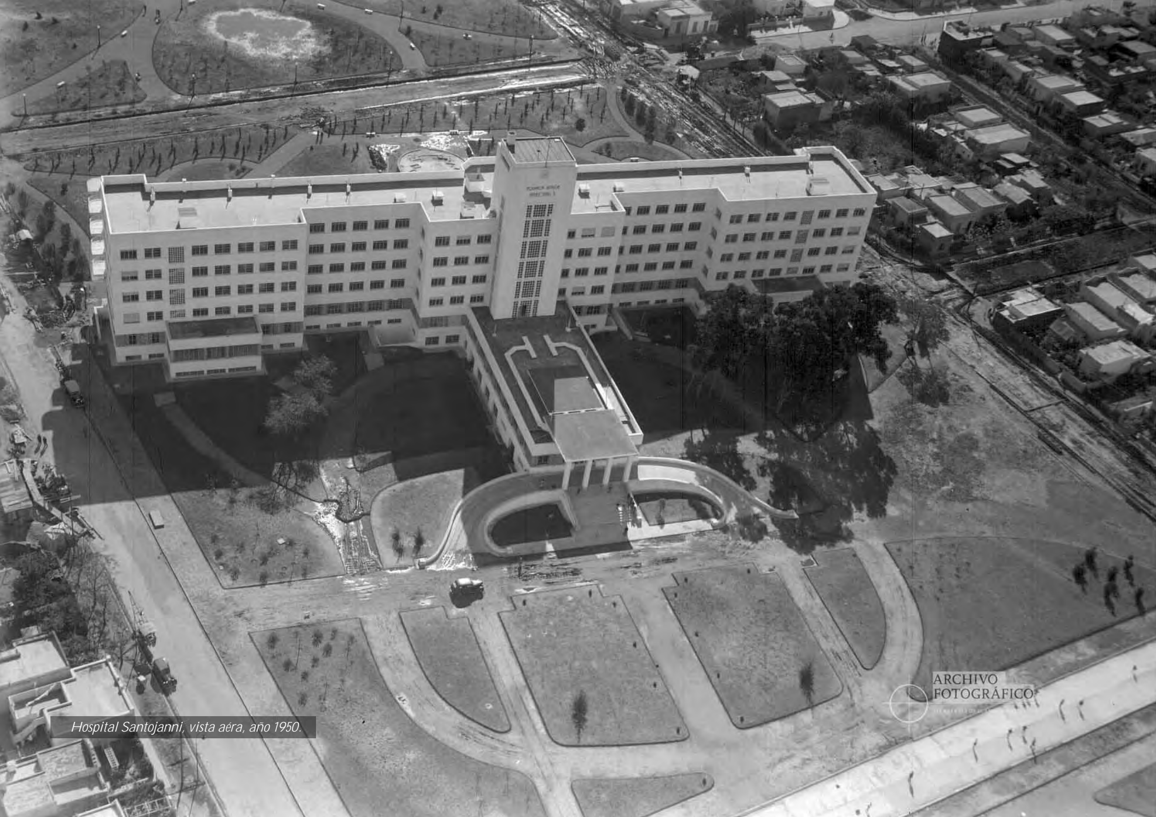
Hospital Santojanni, vista aérea, año 1950.