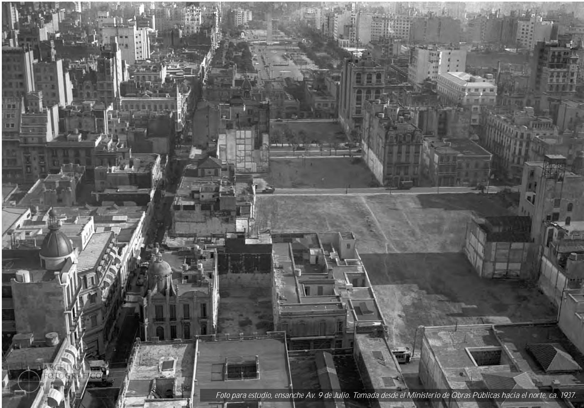
Foto para estudio, ensanche Av. 9 de Julio. Tomada desde el Ministerio de Obras Públicas hacia el norte, ca. 1937.