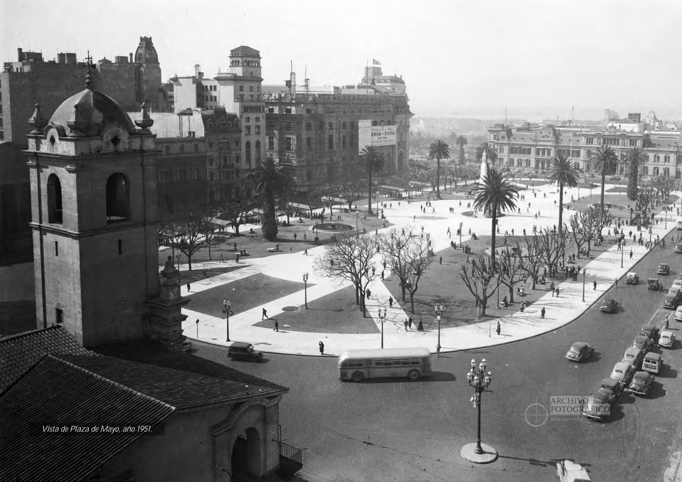
Vista de Plaza de Mayo, año 1951.