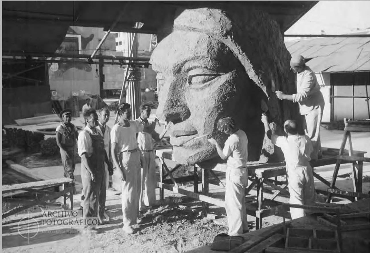
Exposición de minería. Construcción de Monumento, año 1946.