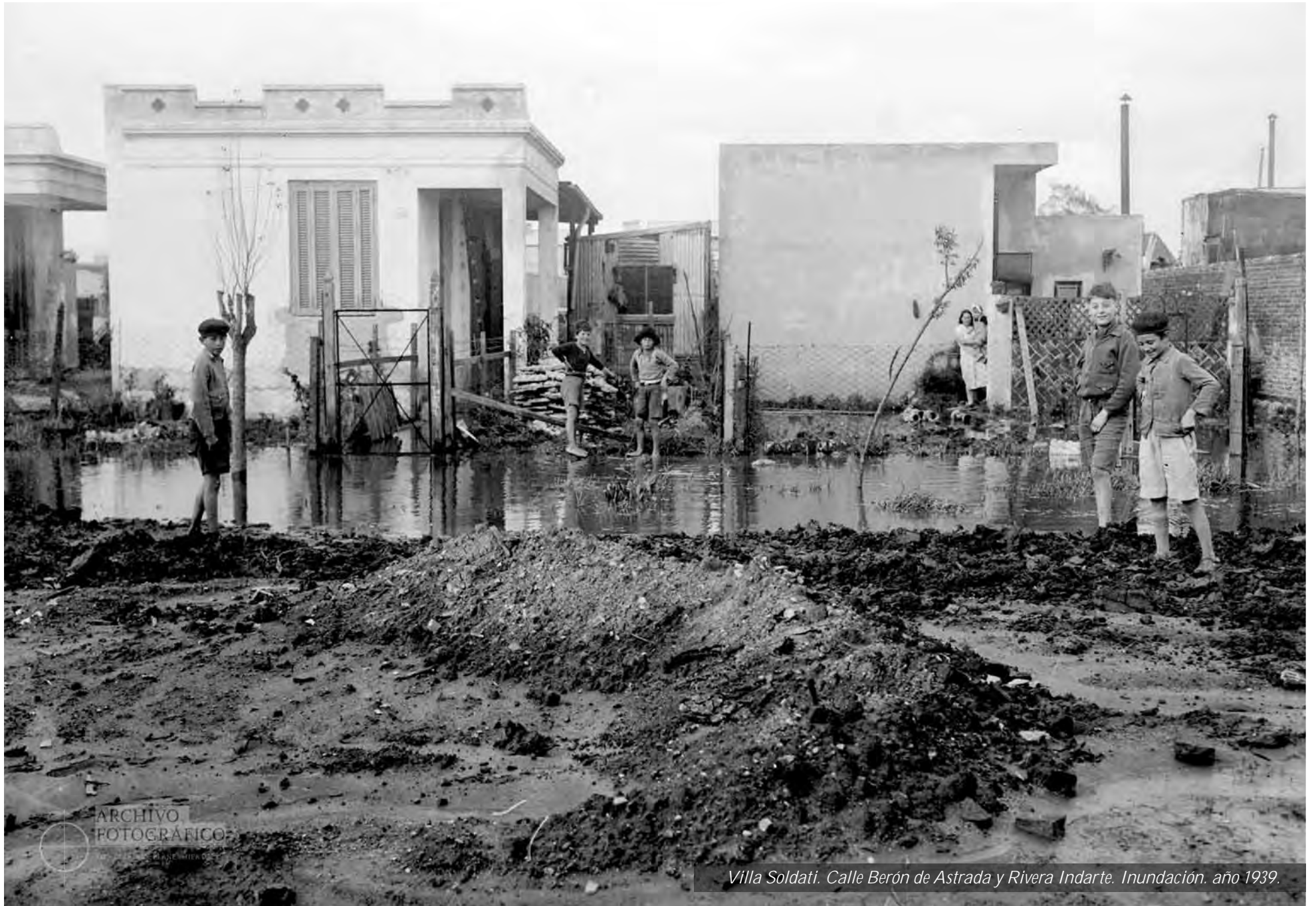
Villa Soldati. Calle Berón de Astrada y Rivera Indarte. Inundación. año 1939.