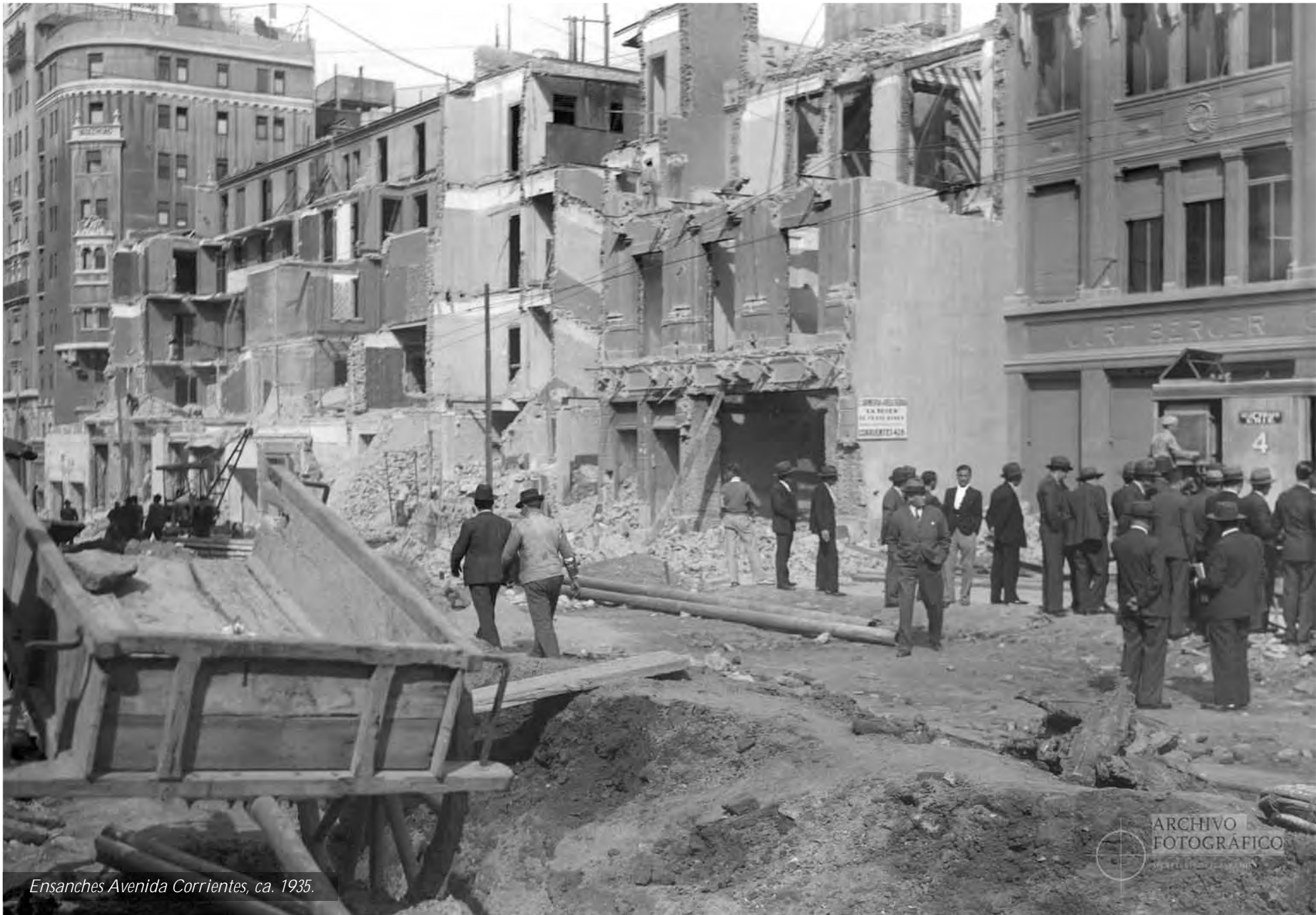
Ensanches Avenida Corrientes, ca. 1935.