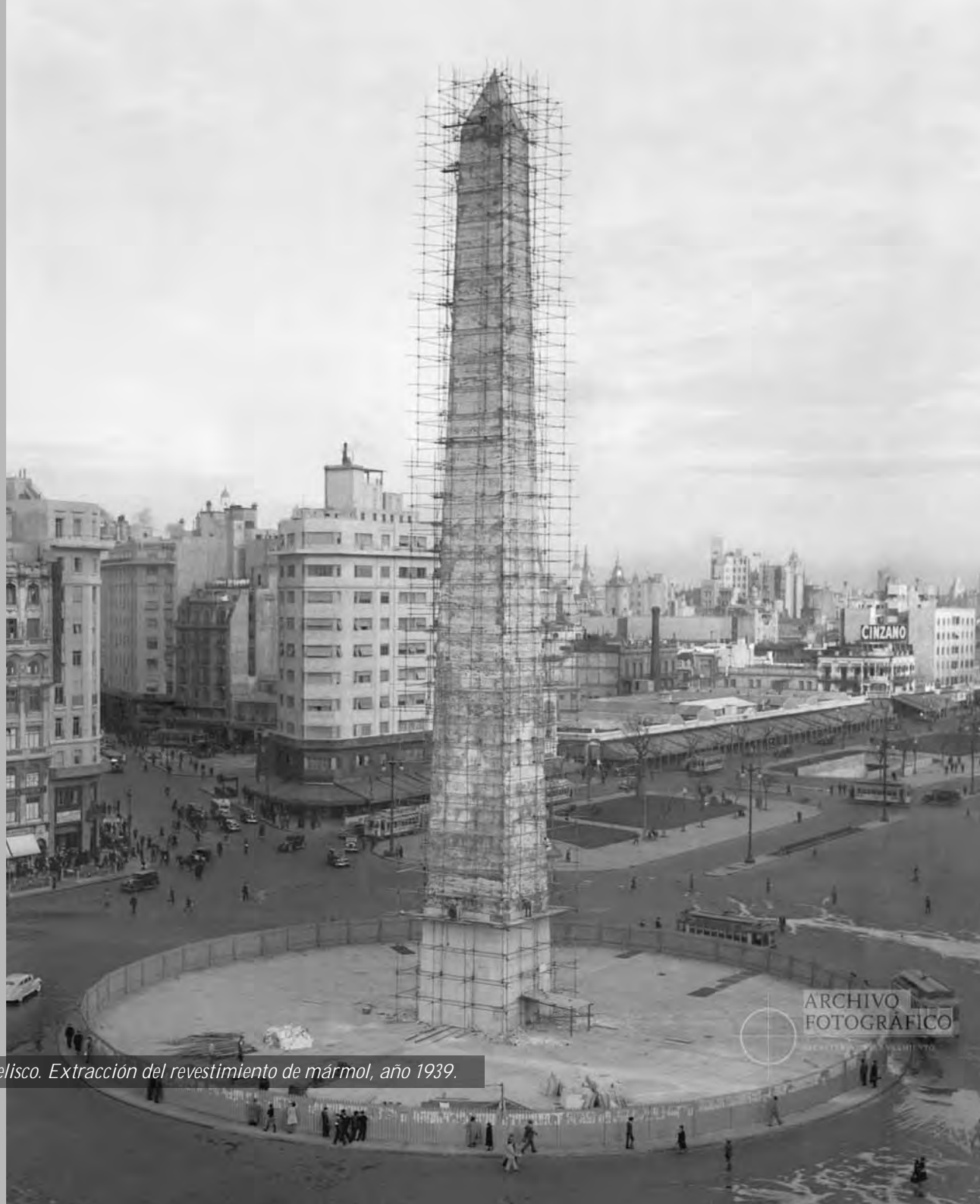
Plaza de la República, Obelisco. Extracción del revestimiento de mármol, año 1939.