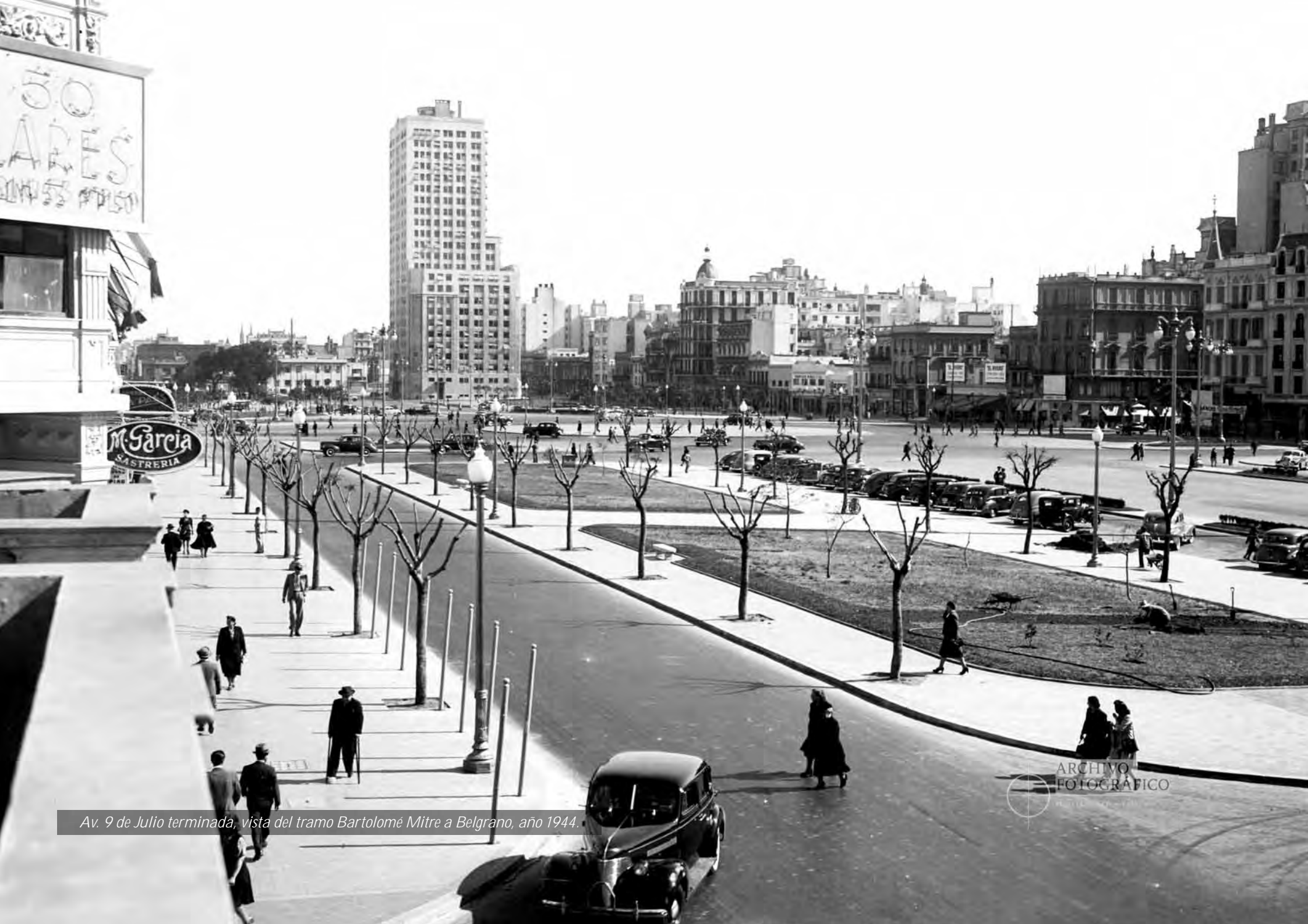
Av. 9 de Julio terminada, vista del tramo Bartolomé Mitre a Belgrano, año 1944.