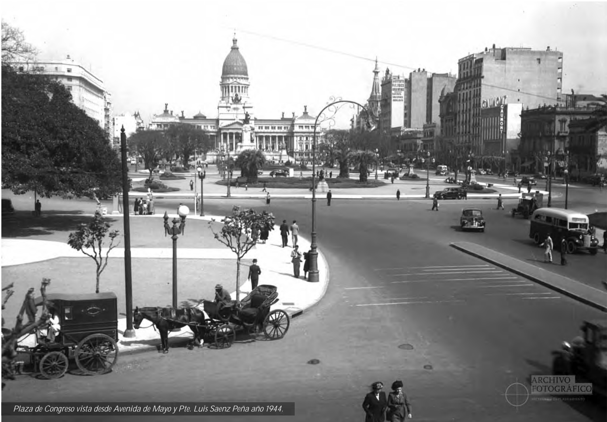
Plaza de Congreso vista desde Avenida de Mayo y Pte. Luis Saenz Peña año 1944.

ARCHIVO FOTOGRAFICO RECUPERANDO UN PLAZAFAMIENTO