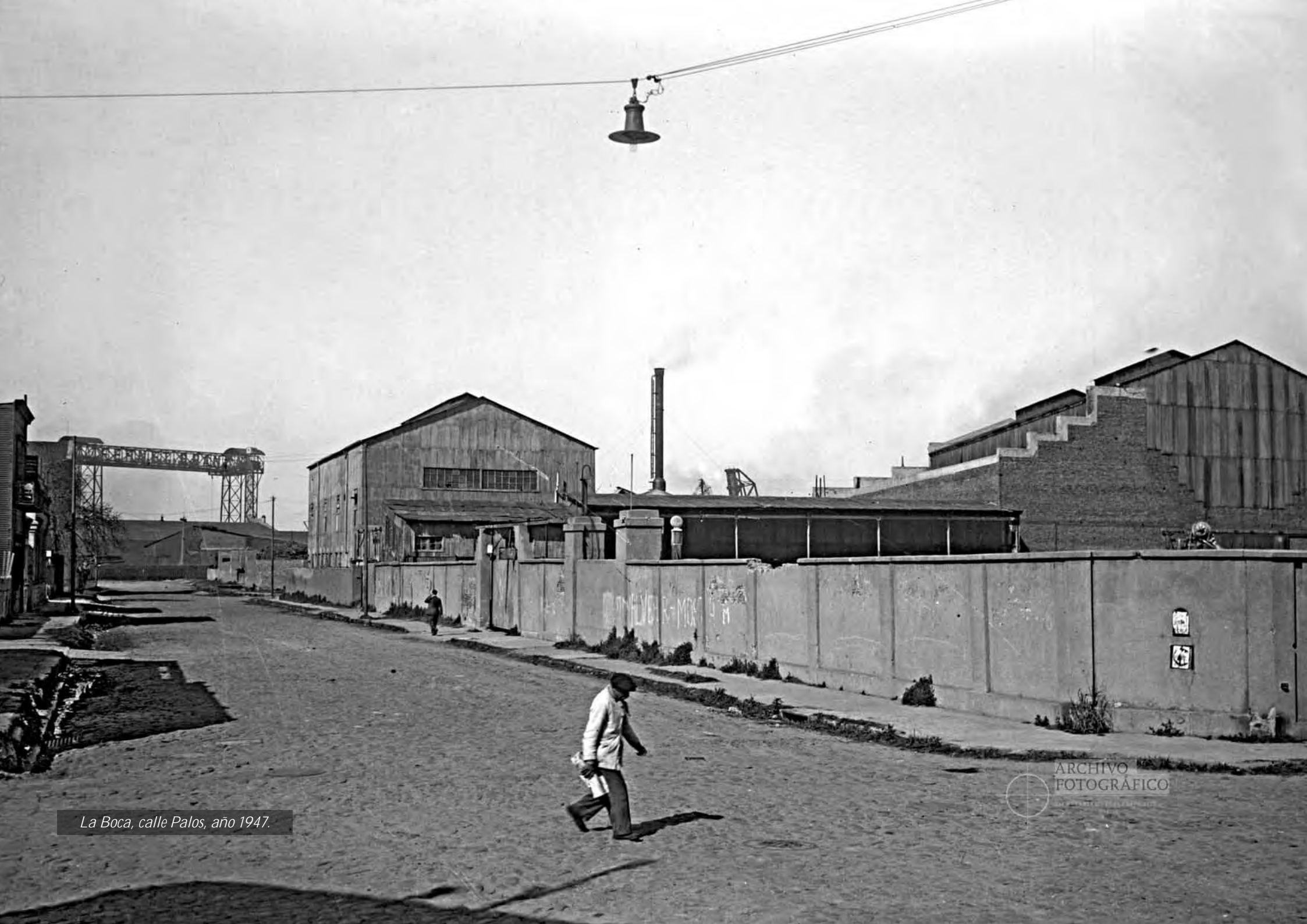
La Boca, calle Palos, año 1947.