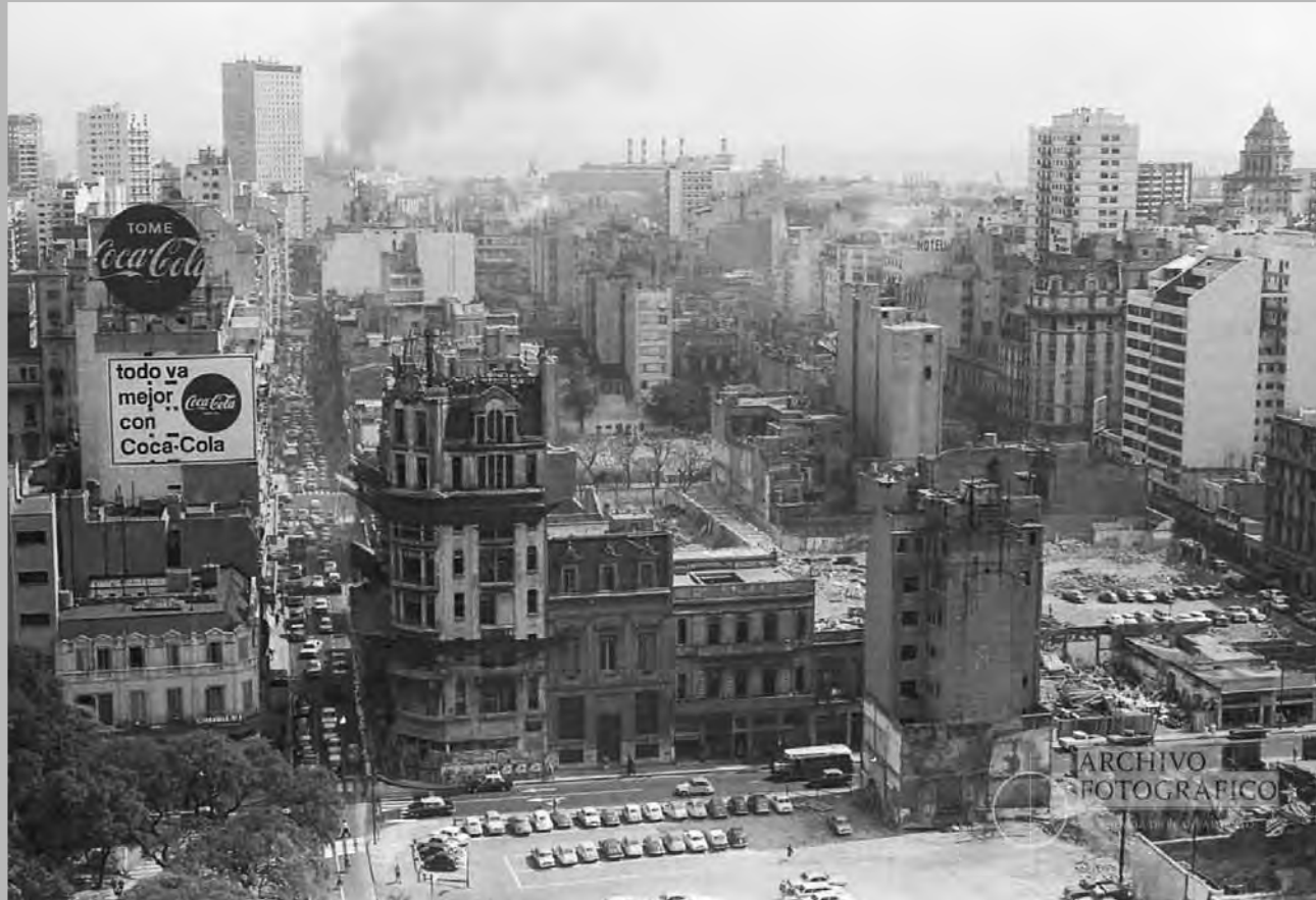
Ensanche Av. 9 de Julio altura Marcelo T. de Alvear, año 1969.